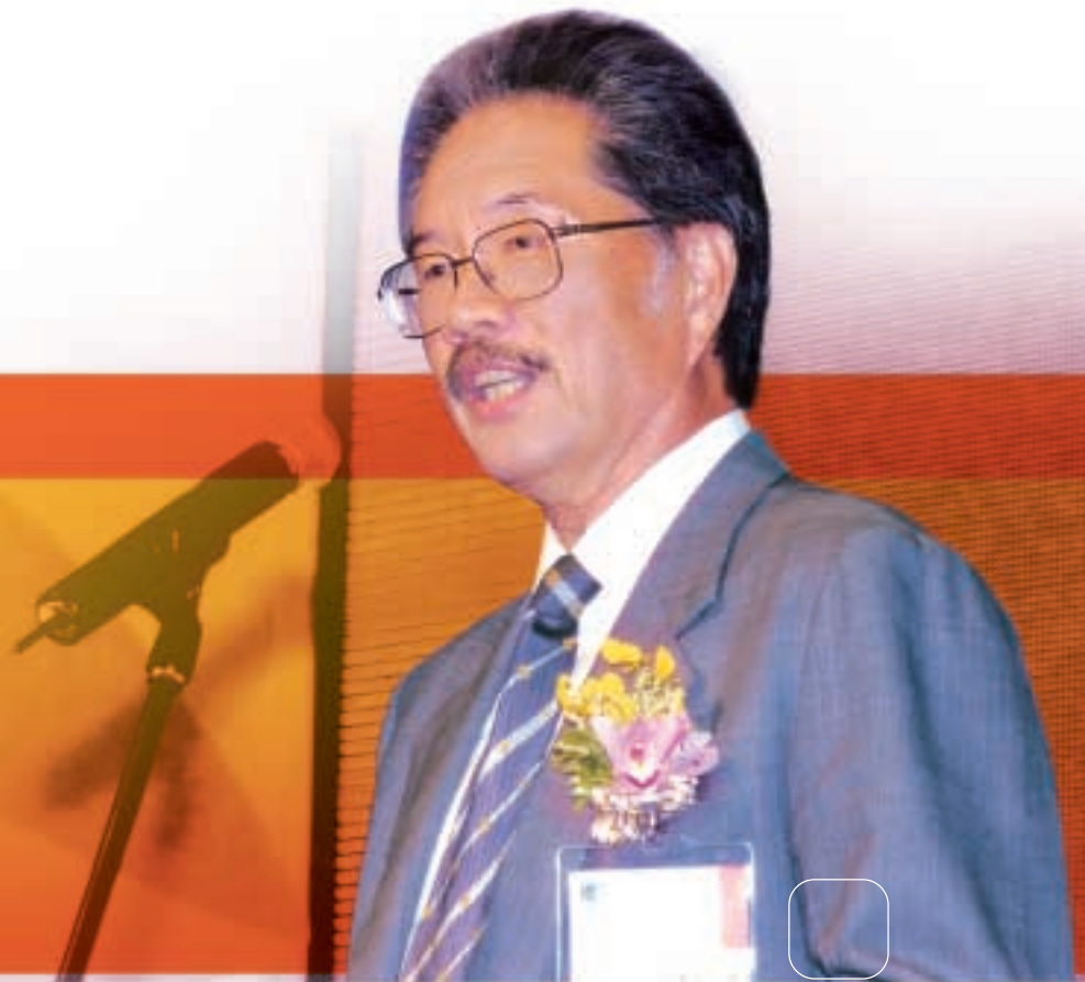
集團主席黃宜弘博士 GBS